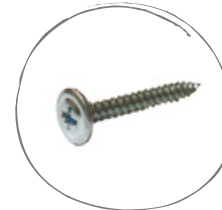
TYPE DE VIS: INOX #8 LONGUEUR: 1.25 POUÇES TÊTE: #8 - ÉTOILE

Il est recommandé d'utiliser les vis disponibles chez Rialux. Les vis doivent être vissées au centre des ouvertures prévues à cet effet et de manière modérée. Il est important de ne pas exercer de pression vers le haut ou vers le bas. Vérifiez l'installation à tous les 3 ou 4 rangs pour s'assurer que le travail est effectué correctement. Pour une meilleure inspection visuelle, veuillez retirer la pellicule de protection au fur et à mesure lors de l'installation.